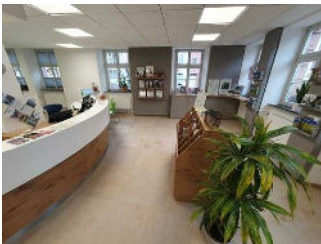
Tourist Information / Kundenraum