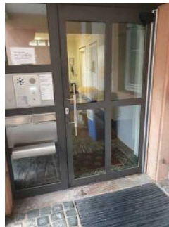
Rathaus Hintereingang (stufenlos)