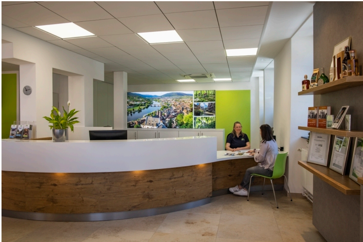
Innenansicht Tourist Information DREI AM MAIN in Miltenberg