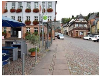
Bushaltestelle am Engelplatz